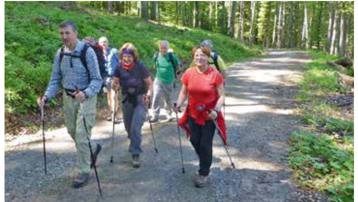
Flotten Schrittes geht es Richtung Plabutsch.

Eine Labung in der Konditorei war natürlich Pflicht und hat die Wanderer für den Aufstieg auf den Plabutsch gestärkt. Beim Bergheurigen angekommen, war die wunderschöne Rundumsicht eine tolle Belohnung. Nach der verdienten Mittagspause ging es weiter leicht bergab zum Thalersee mit einem letzten Einkehrschwung, bevor es wieder zurück zum Ausgangspunkt Plankenwarth ging. Es war eine sehr nette Wanderung voll heimischem Flair!