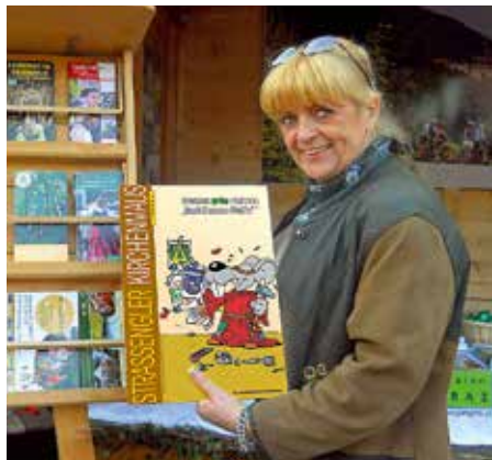
Der Straßengler KirchenMaus-Bote sticht wieder einmal formvollendet hervor zwischen den Urlaubsprospekten von Semriach, Stübing, Übelbach und Co.

kreativen Künstlern fand sich allen voran der international anerkannte Disney-Illustrator aus Aachen, Ulrich Schröder, der die Massen begeisterte und Donald & Co für alle Comic-Fans von 3 bis 99 Jahren zeichnete. Aber auch aus der Alpenrepublik kam ein Zeichner, und dies war natürlich Gerry Lagler. Das Publikum war begeistert von den Geschichten der Straßengler KirchenMaus, dem Maskottchen aus der Marktgemeinde Judendorf-Straßengel. Der neue „Straßengler KirchenMaus-Bote – Text+Bild für Mensch+Maus“ ging buchstäblich weg wie die warmen Semmeln. Die anderen Figuren des Graphikers und Illustrators aus Judendorf-Straßengel, der „Steirer-Man“ und die fette Katze „Shila“, kamen ebenfalls enorm gut an!